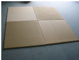
縁無し琉球風置き畳